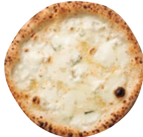
クアットロフォルマッジ 1850 Quattro Formaggi モッツァレラ/ゴルゴンゾーラ/タレッジョ/グラナバダーノ/リコッタチーズ