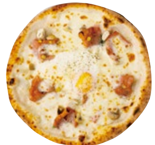
ビスマルクビアンカ 1600 Bismarck Bianca バジル/マッシュルーム/モルタデッラ/モッツァレラ/卵/グラナバダーノ