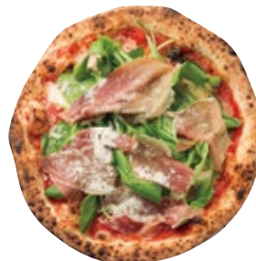
生ハムとルッコラ 1900 Dry-cured Ham Rucola トマトソース/モッツァレラ/生ハム/ルッコラ/リコッタ/グラナバダーノ