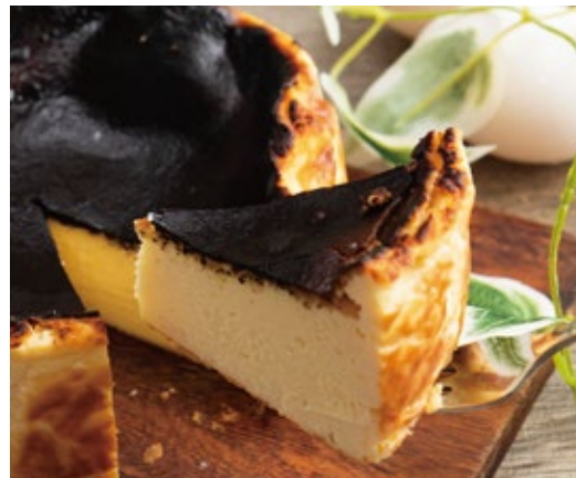
バスクチーズケーキ 720 Burnt Cheesecake

存在感のあるピスタチオのムースに甘酸っぱい木苺。 サクサクパイ生地が食感のアクセント