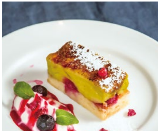
ピスタチオと木苺のシブースト 720 Pistachio & Raspberry Chiboust

存在感のあるピスタチオのムースに甘酸っぱい木苺。 サクサクパイ生地が食感のアクセント