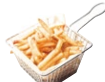
フレンチフライ 500 French Fries