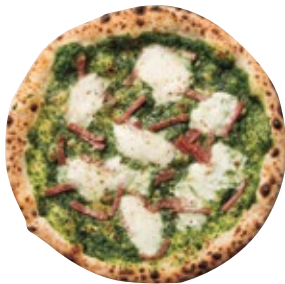
ブラッチョディフェットロ 1500 Braccio Di Ferro モッツァレラ/ほうれん草/リコッタ/パンチェッタ/グラナバダーノ