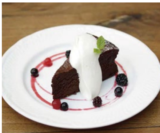
ガトーショコラ 720 Gâteau Chocolat