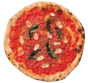
マリナラスペチャーレ 950 Marinara トマトソース/オレガノ/バジル/ニンニク