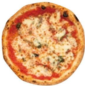
ロマーナ 1400 Romana トマトソース/オレガノ/バジル/アンチョビ/ケッパー/モッツァレラ