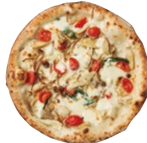
5種のキノコのボスカイオーラ 1700 Boscaiola 白マイタケ/あわび茸/柿木茸/ジャンボ平茸/たもぎ茸/モッツァレラ/ミニトマト/ツナ/ケッパー/バジル