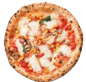
バンビーノロッソ 1500 Bambino Rosso トマトソース/モッツァレラ/コーン/ソーセージ/マッシュルーム