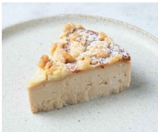
エスプレッソチーズケーキ 720 Espresso Cheesecake

チーズをたっぷり使った濃厚な味わい。 バニラ香る甘さ控えめの大人のチーズケーキ。