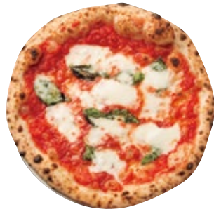
マルゲリータ 1350 Margherita トマトソース/モッツァレラ/グラナバダーノ/バジル

本格的なポリピッツァは1枚1枚丁寧に焼き上げたミールトウギャザー大人気メニュー。