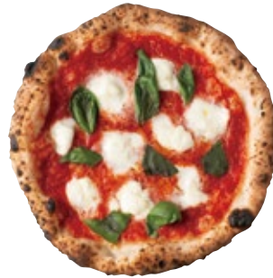
スモークモッツァレラのマルゲリータ 1400 Smoked Mozzarella Margherita トマトソース/バジル/スモークモッツァレラ/グラナバウダー