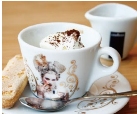
アフォガート 600 Affogato