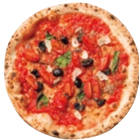
ナポレターナ 1150 Napoletana トマトソース/オレガノ/バジル/ミニトマト/ブラックオリーブ/アンチョビ/ニンニク