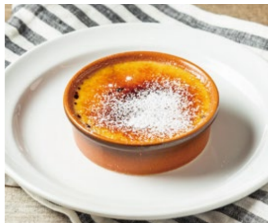
クレームブリュレ 720 Crème Brûlée